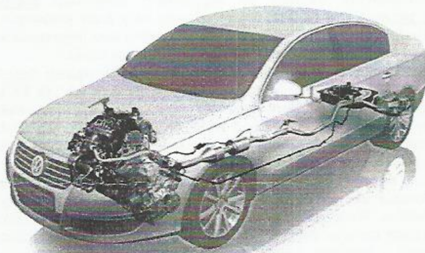
Rozmieszczenie elementów systemu redukującego tlenki azotu NOx w nadwoziu

Opisany sposób uzupełnienia wyposażenia samochodu pozwala na utrzymanie parametrów trakcyjno-eksploatacyjnych pojazdu (zużycie paliwa i moment obrotowy silnika) przy jednoczesnym spełnieniu norm dotyczących norm toksyczności spalin.