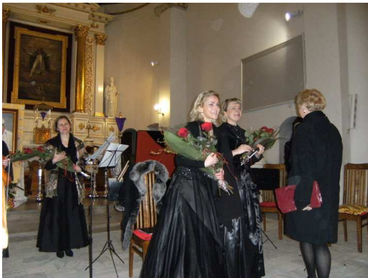
G. B. Pergolesi – Stabat Mater z Zespołem Muzyki Dawnej / oraz Panią Konsulową Litwy /