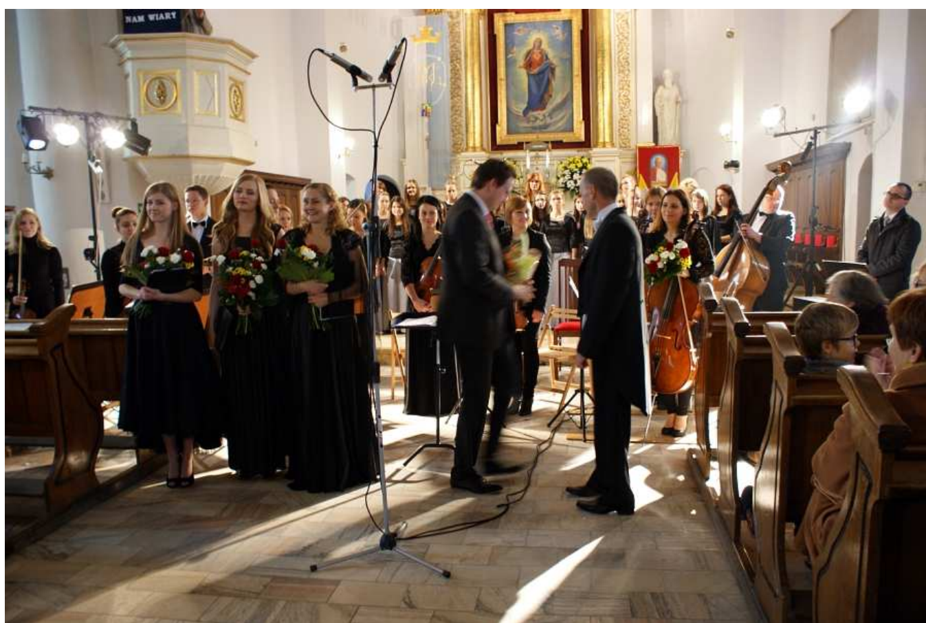
Johann Michael Haydn – Missa Sancti Aloysii’ 2013 / Konkatedra Św Aleksandra, Suwałki /