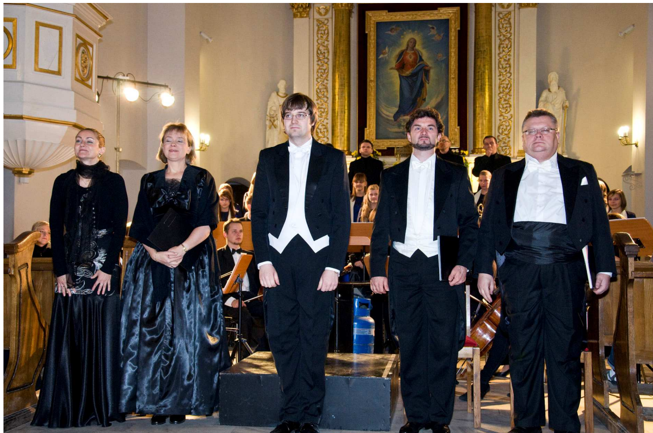
W.A. Mozart – Requiem d-moll’ 2010 / Konkatedra Św Aleksandra, Suwałki /