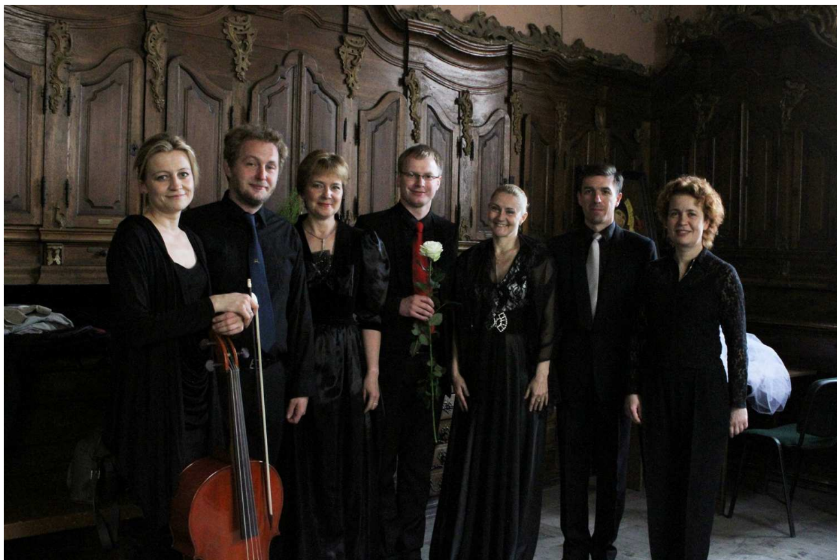
G. B. Pergolesi – Stabat Mater z Zespołem Muzyki Dawnej, Kościół Św. Ducha / Wilno / Litwa /