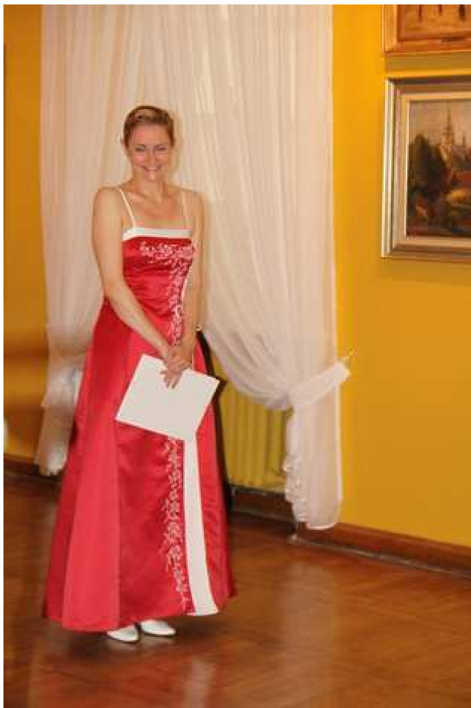
KONCERTY W MUZEUM PODLASKIM W BIAŁYMSTOKU