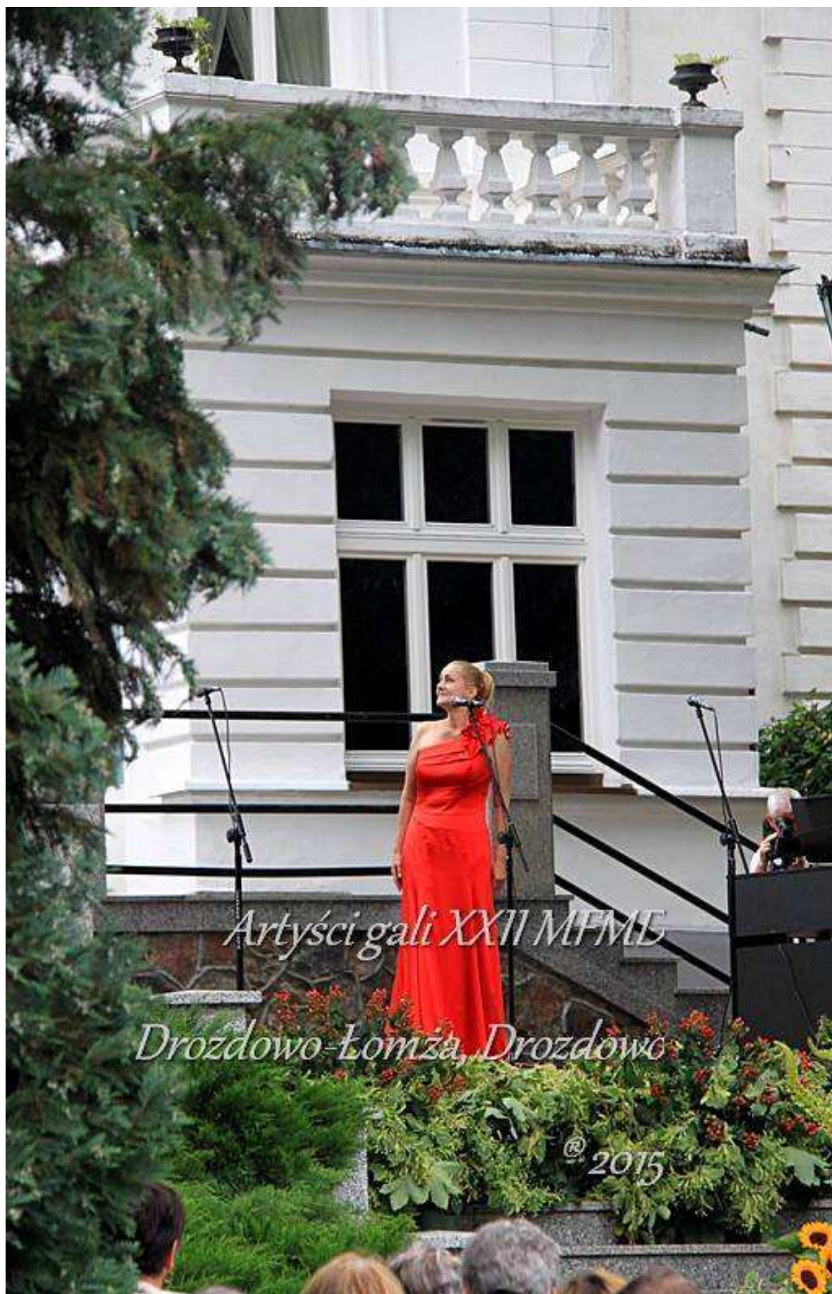
Międzynarodowy Festiwal Drozdowo - Łomża' 2015