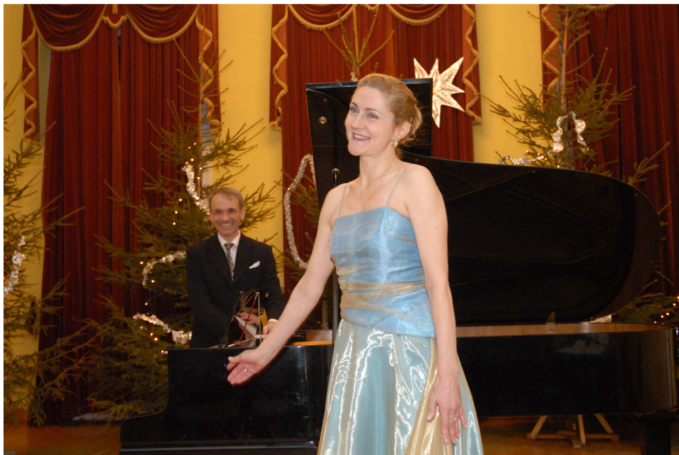
Inauguracja Roku Chopinowskiego' 2010 / Sala Widowiskowa Klubu Garnizonowego JW 1747