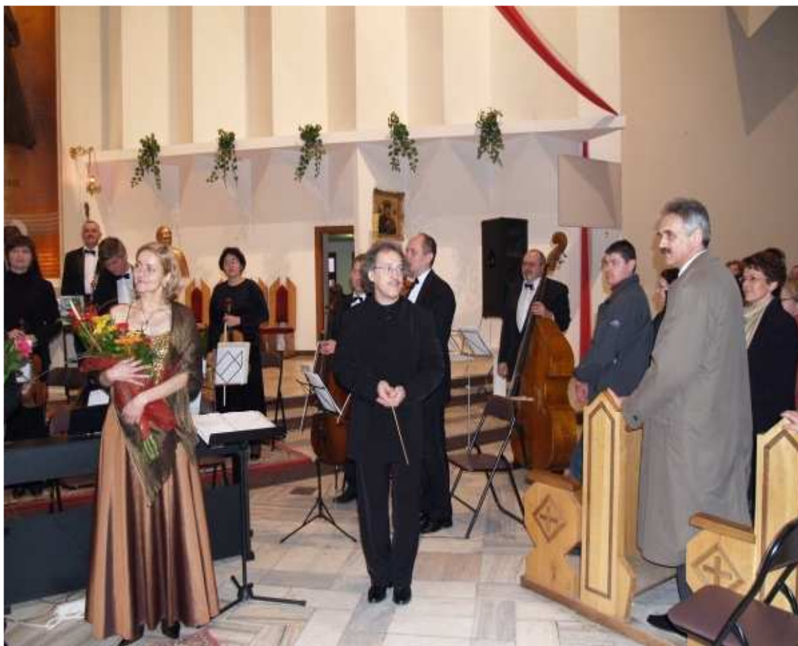
Koncert z Warszawską Orkiestrą Kameralną Warszawskiej Opery Kameralnej pod dyрекcją Zbigniewa Gracy